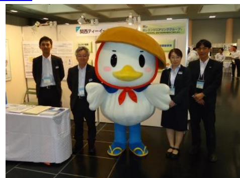
写真中央は「しがの助」

(担当部署: 機器事業本部 営業部 Tel: 077-533-7631 / プラント事業部 営業部 Tel: 077-534-1032)