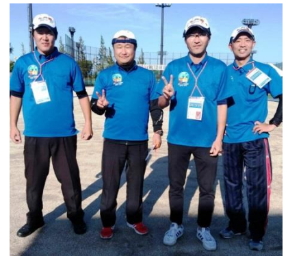
ボランティア仲間とともに(右端:執筆 西原)

ボランティア以外にも各競技の応援や開会式・閉会式への参加と大いにえひめ国体を満喫しました。また、10月28日～30日には第17回全国障害者スポーツ大会も開催され引き続き熱い声援を送りました。